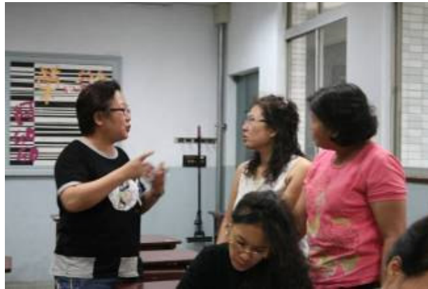
關心新移民的社區民眾正與講師討論事情，希望能為他們盡一份心力。