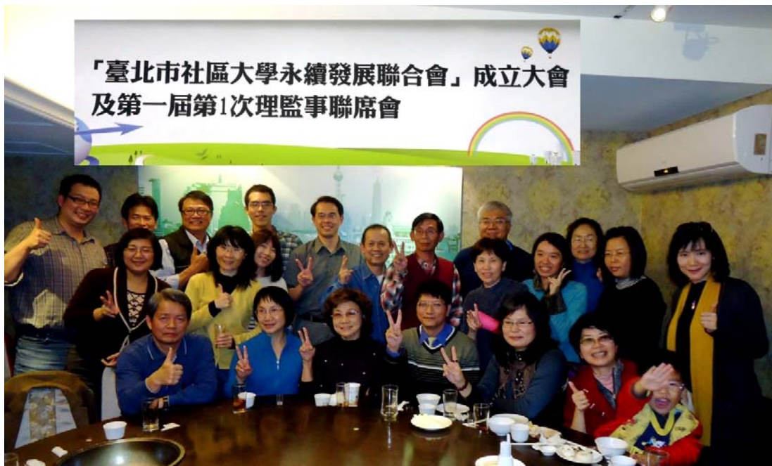
↑ 聯合會成立後，由永續會議承辦地主內湖社大做東大夥至溢香園餐敘