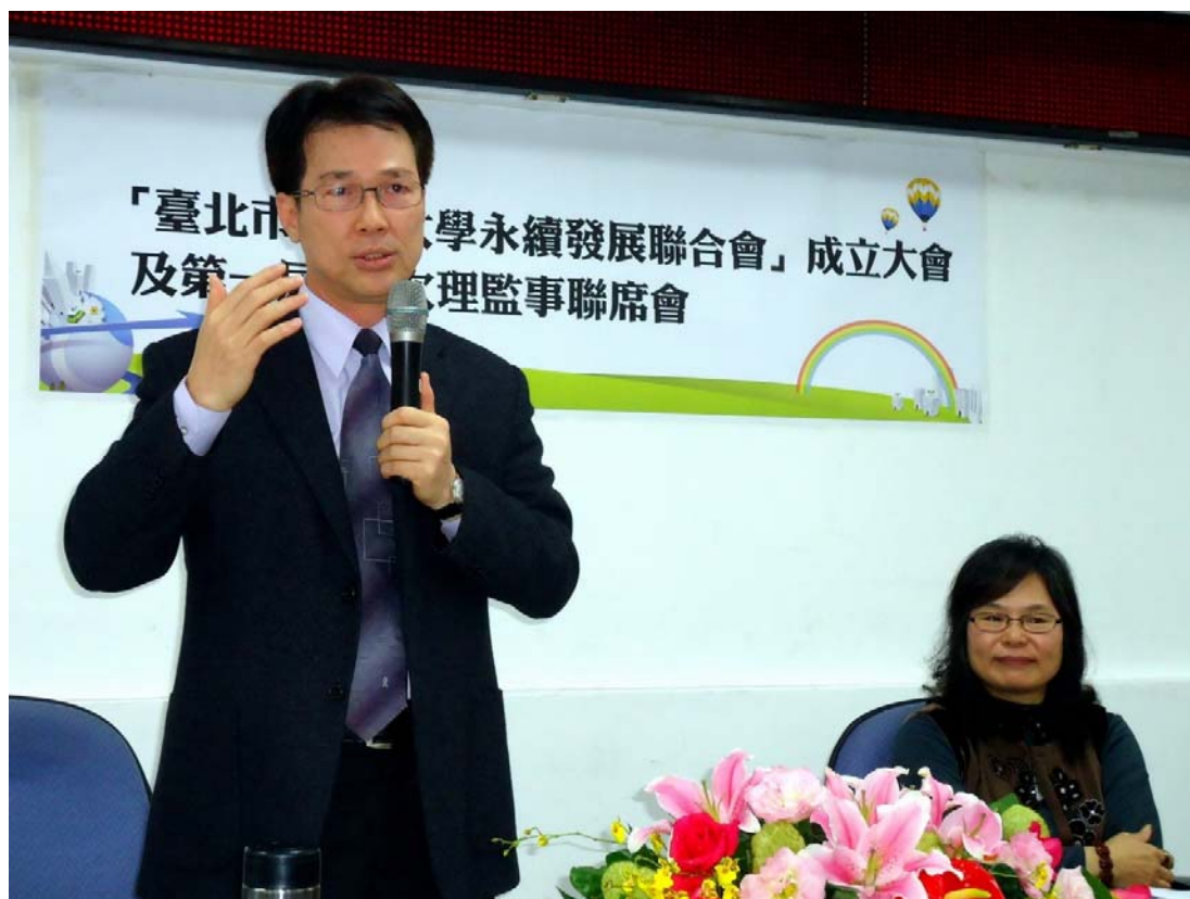
↑臺北市教育局馮副局長清皇蒞會祝福與鼓勵